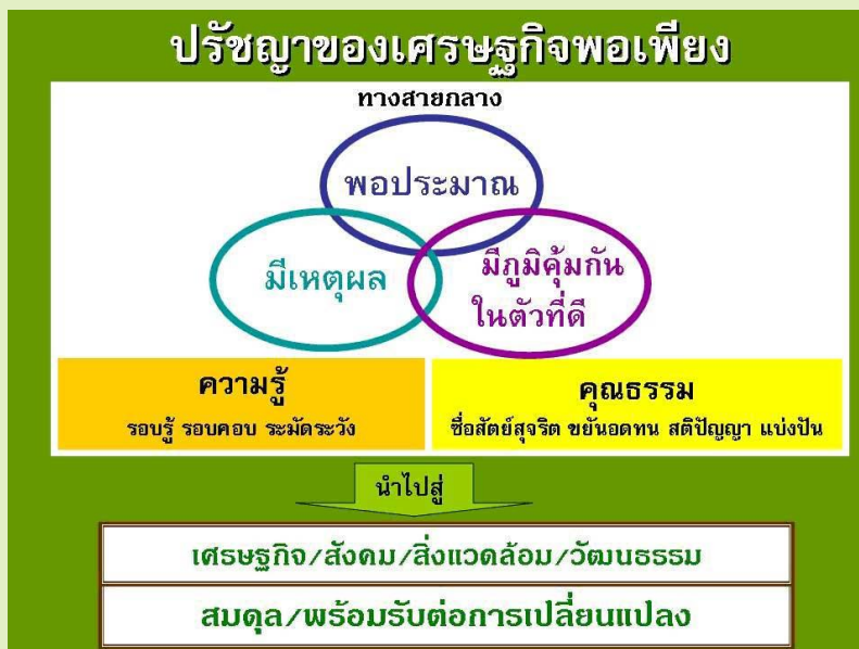
รูปที่ 1. รูปแผนภูมิเศรษฐกิจพอเพียง

องค์ประกอบ 3 ท่วง 2 เงื่อนไข ดังกล่าวแล้วสามารถนำชีวิต องค์การ และประเทศชาติ ไปสู่เศรษฐกิจ สังคม สิ่งแวดล้อม วัฒนธรรม ที่สมดุลความรับผิดชอบต่อการเปลี่ยนแปลง ในแผนภูมิประกอบ