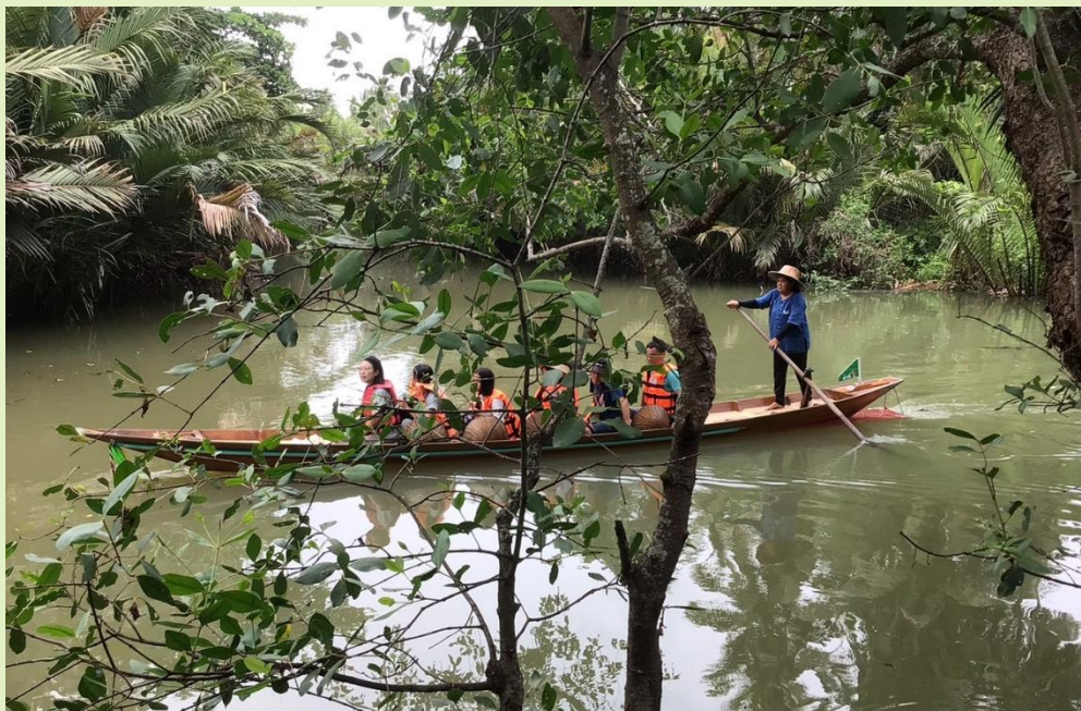
รูปที่ 12. การจัดกิจกรรมการขนส่ง

5. การจัดกิจกรรมการขนส่ง การเดินทางท่องเที่ยวในเขตพื้นที่ใกล้เคียงหมู่บ้าน นอกจากการเดินทางแล้ว อาจใช้พาหนะในหมู่บ้านเข้ามาเป็นพาหนะในการขนส่ง เช่น เกวียน ม้า ช้าง จักรยาน รถยนต์ เรือ แพ เป็นต้น ควรใช้ยานพาหนะที่มีอยู่ในหมู่บ้าน เพื่อให้เกิดประสบการณ์ใหม่ และความประทับใจแก่นักท่องเที่ยว