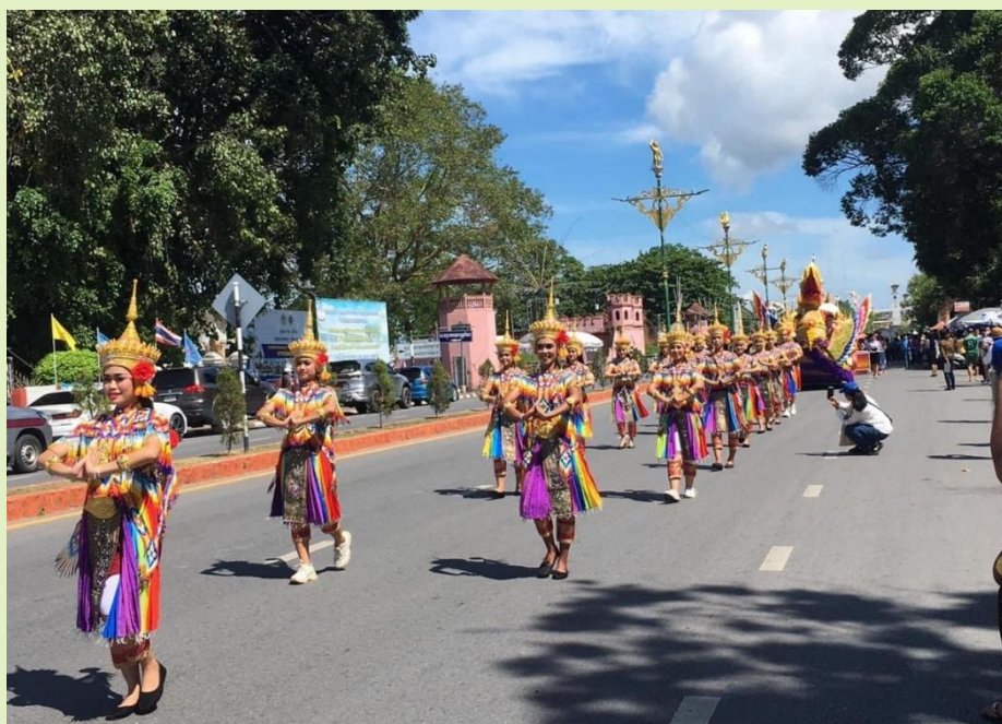
รูปที่ 10. การจัดกิจกรรมการท่องเที่ยวเชิงวัฒนธรรม

จากขอบข่ายของวัฒนธรรม ในลักษณะขององค์รวมแบบ The Culture Wheel การจัดกิจกรรมการท่องเที่ยวทางวัฒนธรรม ซึ่งเป็นองค์ประกอบอย่างหนึ่ง ของ เศรษฐกิจเชิงสร้างสรรค์ ก็สามารถจัดวัฒนธรรมดังกล่าวแล้ว เสนอต่อบริษัทท่องเที่ยว ในด้านศิลปะ งานฝีมือ อาหารและเครื่องดื่ม จารีตประเพณี หรือ วิถีชีวิตอื่น ๆ ในชุมชน เพื่อให้นักท่องเที่ยว เกิดการเรียนรู้ และเข้าร่วมกิจกรรม เช่น ร่วมกิจกรรมการทำอาหาร การทำงานด้านศิลปะ การจารีตประเพณีในท้องถิ่นตามฤดูกาล