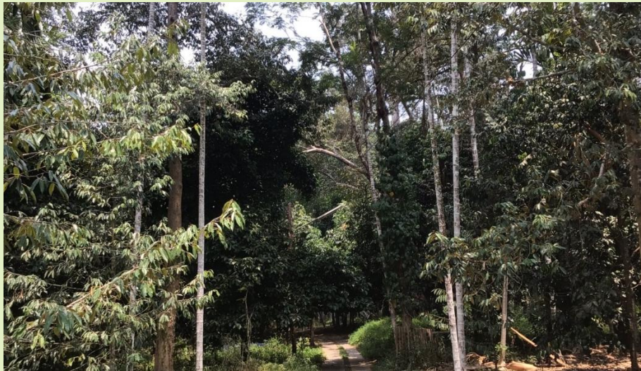
รูปที่ 5. การปลูกพืช 3 อย่าง เพื่อประโยชน์ 4 อย่าง

3. ปลูกพืช 3 อย่างประโยชน์ 4 อย่าง คือ ปลูกพืชเพื่อกิน เพื่อใช้สอย เพื่อขาย และประโยชน์ข้อที่ 4 คือ อนุรักษ์ดินและน้ำ การปลูกพืช ควรปลูกพืชที่มีรายได้ประจำวัน ประจำเดือน เช่น ผัก ผลไม้ เห็ด ฯลฯ ประจำปี เช่น ไม้ผล ซึ่งออกผลปีละครั้ง และไม้ซึ่งเป็นบำนาญ ของชีวิตในวัยชรา ได้แก่ ไม้ยืนต้น เช่น ไม้พยูง ไม้ชิงชัน ไม้แดง ไม้สัก ไม้ก้ามกราก ไม้ตะเคียน ฯลฯ