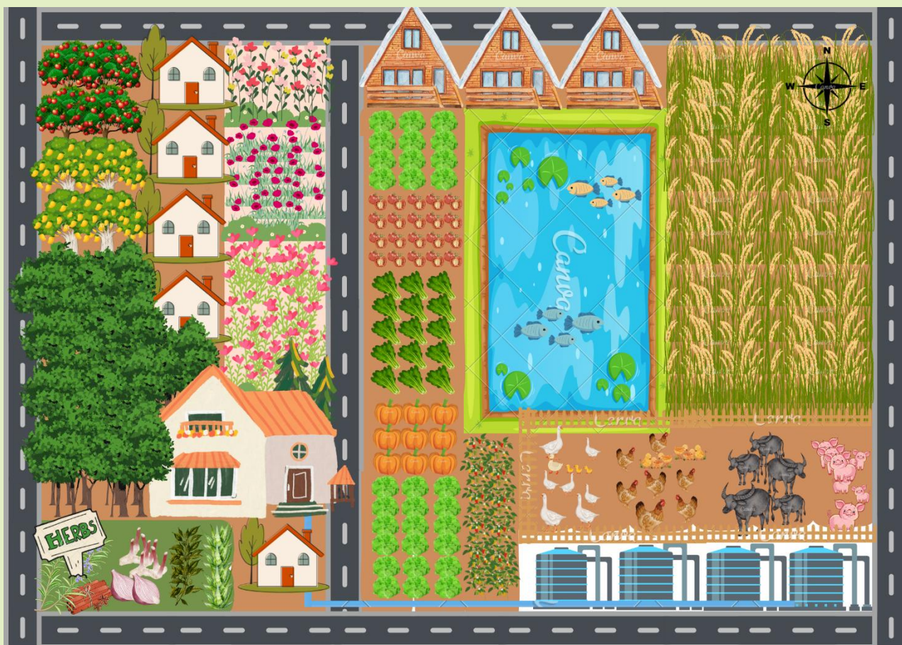
รูปที่ 2. แผนผังแสดงรูปแบบการท่องเที่ยวในมิติเศรษฐกิจพอเพียง ออกแบบโดย ชูสิทธิ์ ชูชาติ