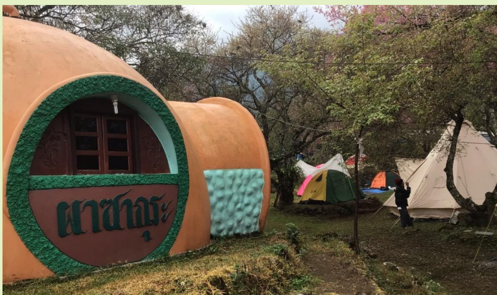
รูปที่ 7. การจัดที่พักเฉพาะบางฤดูกาล

ที่พักอาจเริ่มต้น ด้วยการกางเต็นท์ Eco lodge หรือห้องพักเล็ก ๆ หรือการแบ่งบ้านพัก ให้นักท่องเที่ยวอยู่อาศัยแบบ Homestay