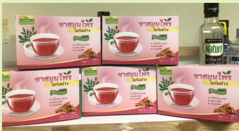
รูปที่ 13. ของที่ระลึก

ในท้องถิ่น มีการทำเหมือง ของที่ระลึกที่เกิดขึ้นจากเหมือง เช่น อาหาร เครื่องดื่ม ผ้าย้อมสีน้ำเมียง ต่างเหมืองจำลอง วิวต่างจำลอง เป็นต้น หมู่บ้านนี้มีการผลิตไม้ไผ่ เภาวัลย์ หรือหวาย ของที่ระลึกก็ควรผลิตจากวัสดุประเภทดังกล่าวแล้ว