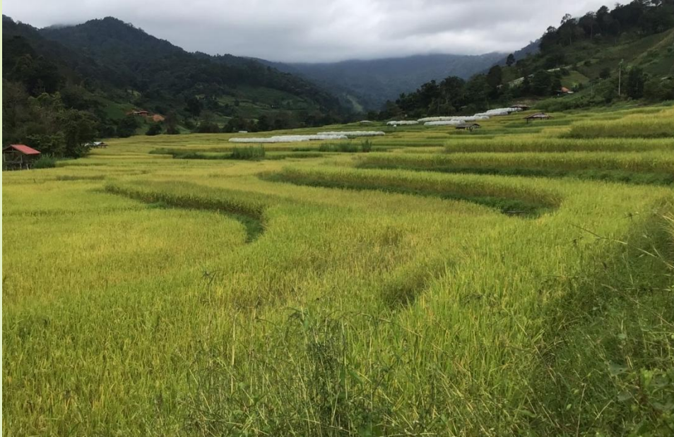
รูปที่ 3. การทำนา

2. การสร้างอ่างเก็บน้ำ หรือสระน้ำ เพื่อเก็บน้ำไว้ใช้ในการเพาะปลูก เลี้ยงสัตว์ หรือ เลี้ยงสัตว์น้ำ เช่น กุ้ง หอย ปู ปลา หรือ เลี้ยงเป็ด และเลี้ยงพืชน้ำ เช่น ผักบุ้ง ผักกระเฉด แหนแดง พืชน้ำดังกล่าวแล้ว สามารถเป็นอาหารของคนและสัตว์ ส่วนที่เหลือสามารถหมักแก๊สชีวภาพ หรือทำปุ๋ย ซึ่งสอดคล้องกับ BCG