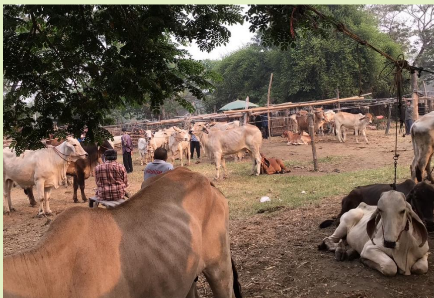
รูปที่ 6. ตลาดวัวควาย แหล่งค้าขายสัตว์เลี้ยง

4. เลี้ยงสัตว์ ได้แก่ ไก่ เป็ด ห่าน วัว ควาย แพะ หมู ไว้เพื่อกิน เพื่อขาย และได้มูลสัตว์ ทำแก๊สชีวภาพ ปุ๋ย สัตว์เหล่านี้ยังช่วยปราบวัชพืชและบำรุงดิน พื้นที่ปลูกป่าไม้ยืนต้น ควรเลี้ยงผึ้งเพื่อช่วยผสมเกสรและได้ผลผลิตจากน้ำผึ้ง ขี้ผึ้ง