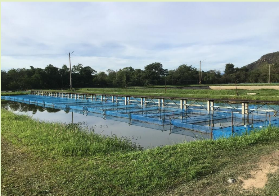
รูปที่ 4. อ่างเก็บน้ำและบ่อเลี้ยงปลา

2. การสร้างอ่างเก็บน้ำ หรือสระน้ำ เพื่อเก็บน้ำไว้ใช้ในการเพาะปลูก เลี้ยงสัตว์ หรือ เลี้ยงสัตว์น้ำ เช่น กุ้ง หอย ปู ปลา หรือ เลี้ยงเป็ด และเลี้ยงพืชน้ำ เช่น ผักบุ้ง ผักกระเฉด แหนแดง พืชน้ำดังกล่าวแล้ว สามารถเป็นอาหารของคนและสัตว์ ส่วนที่เหลือสามารถหมักแก๊สชีวภาพ หรือทำปุ๋ย ซึ่งสอดคล้องกับ BCG