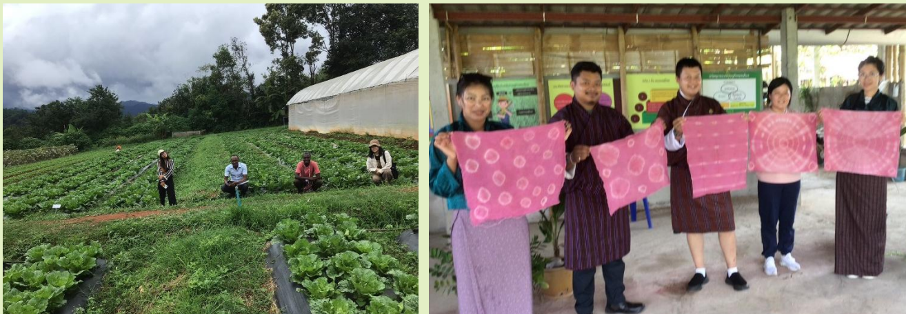
รูปที่ 9. การจัดกิจกรรมการท่องเที่ยว

ได้ประสบการณ์ใหม่ เข้าใจถึงความสำคัญของระบบนิเวศป่า ความหลากหลายทางชีวภาพ ที่มีความสำคัญและสัมพันธ์กับมนุษย์ และส่งผลถึงการอนุรักษ์สิ่งแวดล้อม