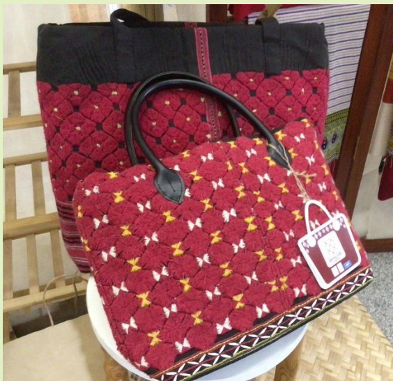
รูปที่ 11. การจัดกิจกรรมการท่องเที่ยวเชิงวัฒนธรรม

5. การจัดกิจกรรมการขนส่ง การเดินทางท่องเที่ยวในเขตพื้นที่ใกล้เคียงหมู่บ้าน นอกจากการเดินทางแล้ว อาจใช้พาหนะในหมู่บ้านเข้ามาเป็นพาหนะในการขนส่ง เช่น เกวียน ม้า ช้าง จักรยาน รถยนต์ เรือ แพ เป็นต้น ควรใช้ยานพาหนะที่มีอยู่ในหมู่บ้าน เพื่อให้เกิดประสบการณ์ใหม่ และความประทับใจแก่นักท่องเที่ยว