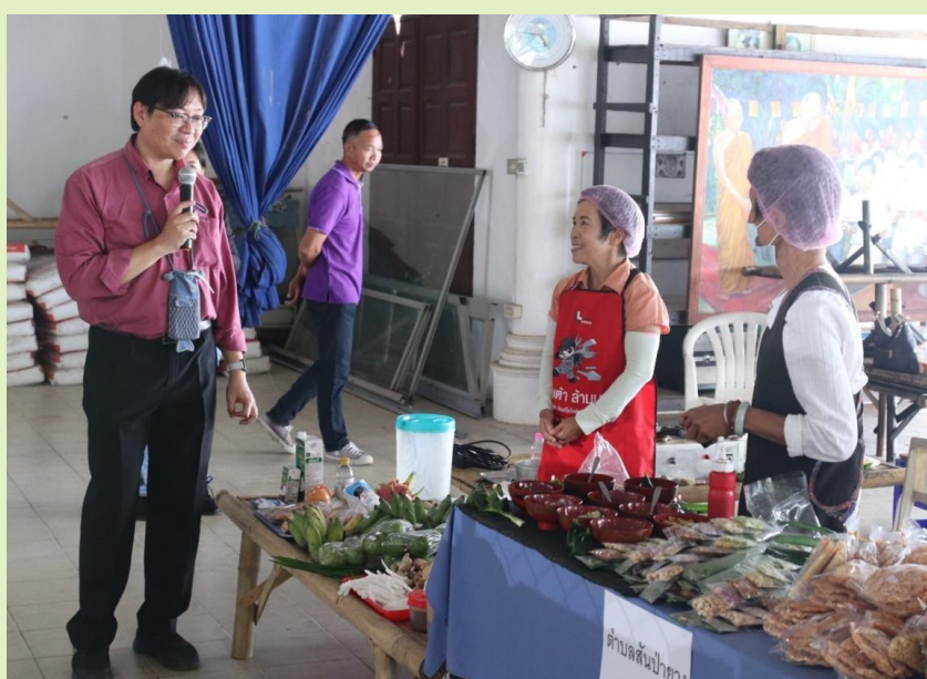
รูปที่ 8. การจัดอาหารโดยใช้วัสดุที่ผลิตเอง

จากตัวอย่างอาหาร ก็สามารถนำไปใช้กับการผลิตเครื่องดื่ม ต้นทุนราคาเครื่องดื่มประมาณร้อยละ 25 ดังนั้นการแสวงหากำไรในเชิงธุรกิจจากเครื่องดื่ม จึงได้กำไรมากกว่าสินค้าอาหาร