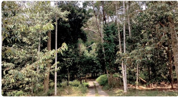
▶ การปลูกพืช 3 อย่าง เพื่อประโยชน์ 4 อย่าง