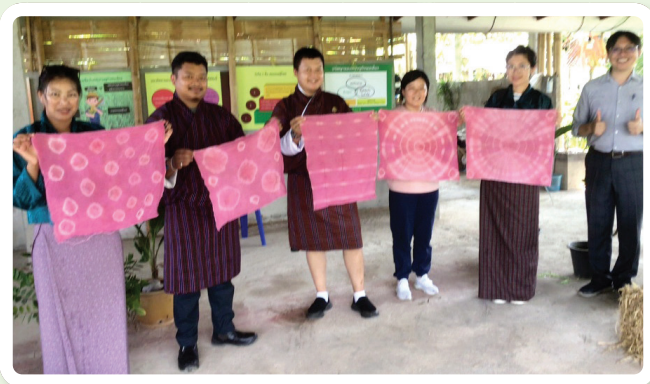
การจัดกิจกรรมการท่องเที่ยว

• การจัดกิจกรรมการท่องเที่ยวทางธรรมชาติ เช่น การเดินป่าศึกษา ระบบนิเวศป่า ความหลากหลายทางชีวภาพของสัตว์และพืชในท้องถิ่น การนำชม แหล่งท่องเที่ยวตามธรรมชาติ เช่น ถ้ำ น้ำตก หน้าผา เกาะ แหล่ม ชายหาด ฯลฯ หลักการสำคัญของการนำชม คือ นักท่องเที่ยวต้องเกิดการเรียนรู้ได้ประสบการณ์ใหม่ เข้าใจถึงความสำคัญของระบบนิเวศป่า ความหลากหลายทางชีวภาพ ที่มีความสำคัญ และสัมพันธ์กับมนุษย์ และส่งผลถึงการอนุรักษ์สิ่งแวดล้อม