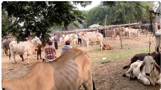
ตลาดวัวควาย ▶ แหล่งค้าขาย สัตว์เลี้ยง