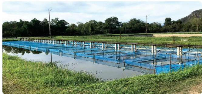
อ่างเก็บน้ำและ บ่อเลี้ยงปลา