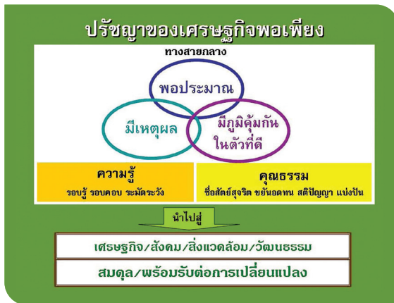
• รูปแผนภูมิเศรษฐกิจพอเพียง

องค์ประกอบ 3 ห่วง 2 เงื่อนไซ ดังกล่าวแล้วสามารถนำชีวิต องค์การ และประเทศชาติ ไปสู่เศรษฐกิจ สังคม สิ่งแวดล้อม วัฒนธรรม ที่สมดุลพร้อมรับต่อการเปลี่ยนแปลง ตามแผนภูมิประกอบ