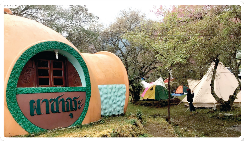
การจัดที่พักเฉพาะบางฤดูกาล