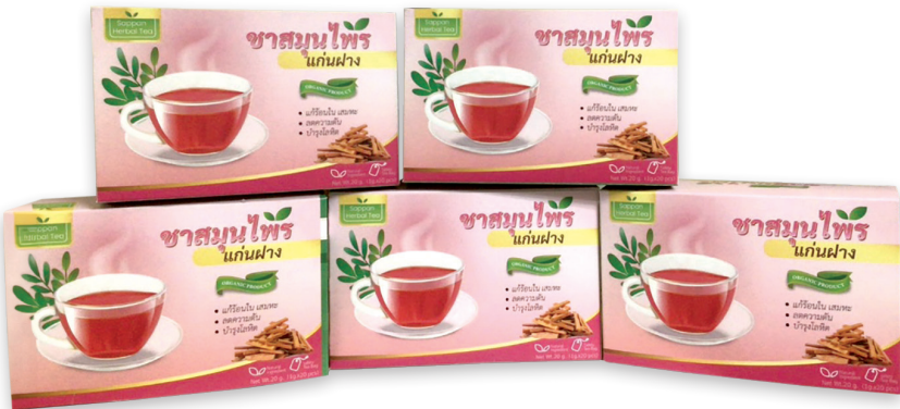
ของที่ระลึก

ในท้องถิ่นมีการทำเหมือง ของที่ระลึกที่เกิดขึ้นจากเหมือง เช่น อาหาร เครื่องดื่ม ผ้าย้อมสีน้ำเหมือง ต่างเหมืองจำลอง วัวต่างจำลอง เป็นต้น หมู่บ้านนี้ มีการผลิตไม้ไผ่ เถาวัลย์ หรือหวาย ของที่ระลึกก็ควรผลิตจากวัสดุประเภทดังกล่าว แล้ว