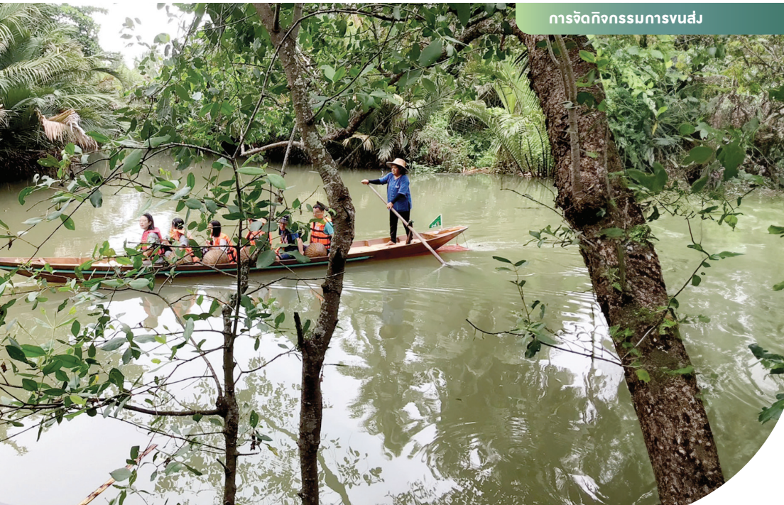
การจัดกิจกรรมการvus่