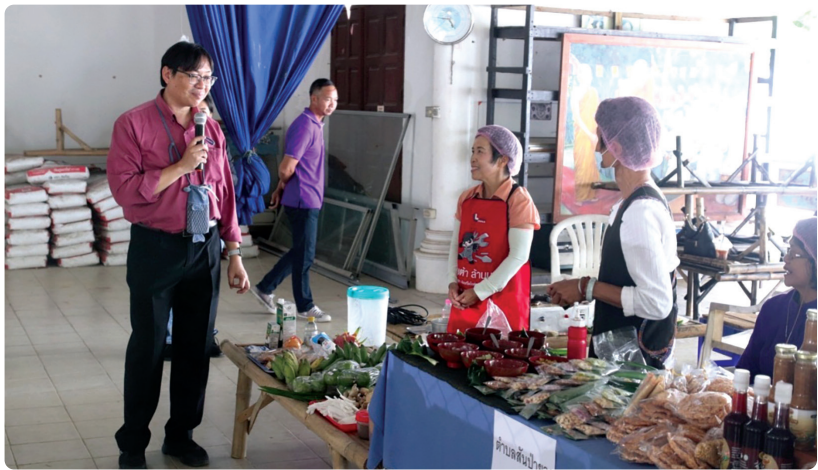
การจัดอาหารโดยใช้วัสดุที่ผลิตเอง

(Food Cost) ประมาณร้อยละ 30 - 35 หมายความว่า ต้นทุนค่าอาหาร และเครื่องปรุง 30 บาท คิดราคาขาย (Cost Price) ราคา 100 บาท ส่วนเกิน ต้นทุนอาหาร จำนวน 70 บาท รวมทั้งค่าแรงงาน ค่าเสื่อมทุน ค่าประกันภัย กำไร รวมทั้งค่าใช้จ่ายอื่น ๆ มิใช่กำไรอย่างเดียว จำนวน 70 บาท