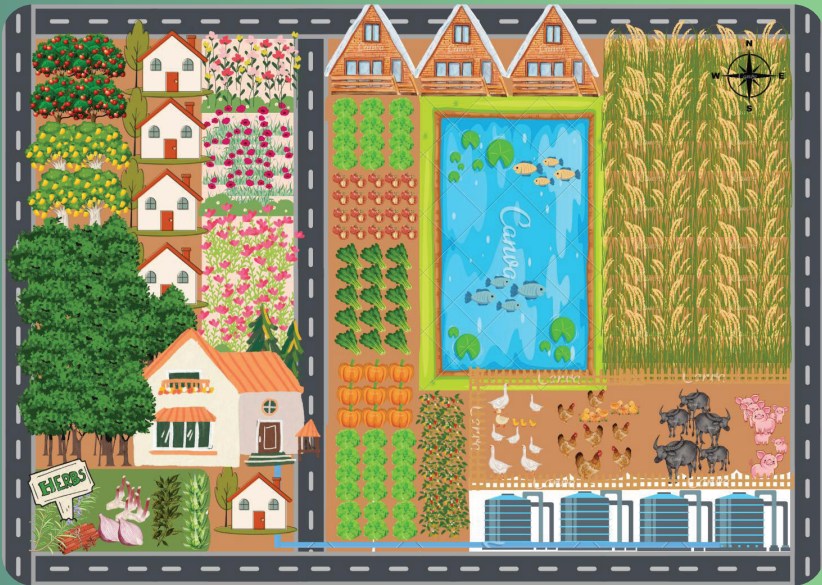
แผนผังแสดงรูปแบบการท่องเที่ยวในมิติเศรษฐกิจพอเพียง